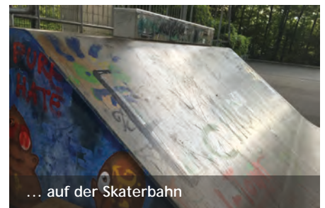
... auf der Skaterbahn