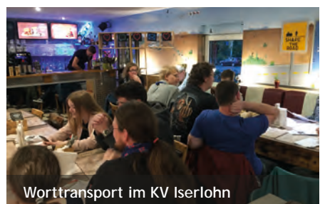
Worttransport im KV Iserlohn