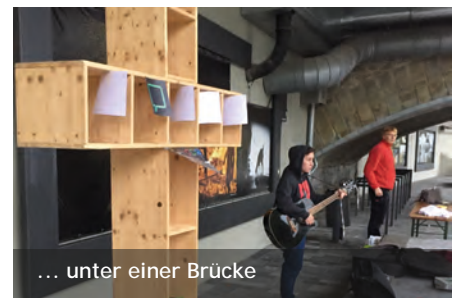
... unter einer Brücke