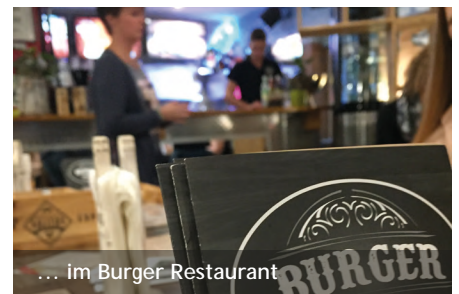
... im Burger Restaurant